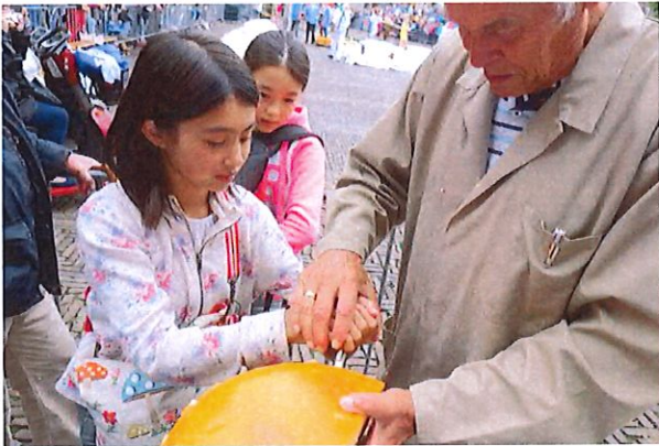
自然教室 アルクマール