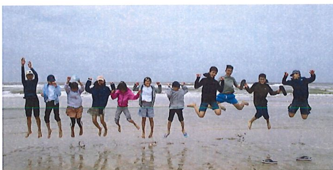
移動教室 プライスバイク