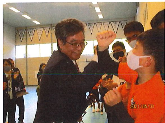
開校からロッテルダム日本人学校を 支えてきた塚口教頭先生が定年退職