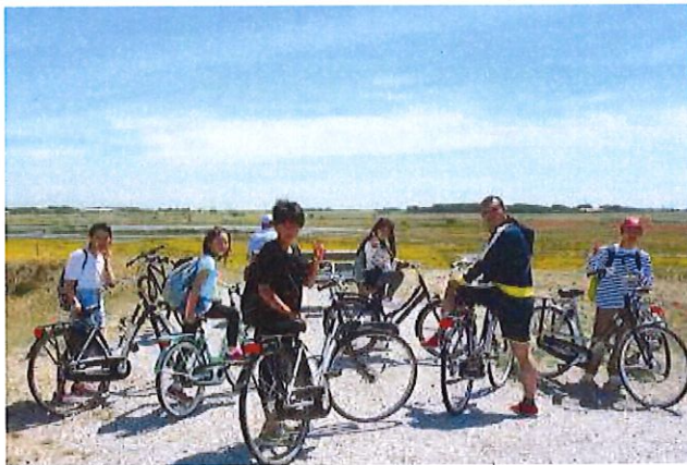
移動教室 テクセル島