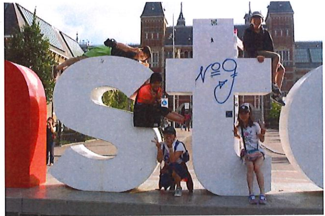
修学旅行 アムステルダム