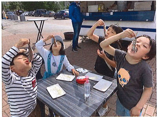
ハーリングレッスン