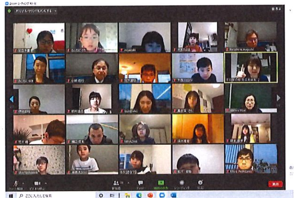
コロナ禍の中のオンライン全校集会