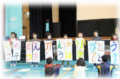
【思い出や活躍の紹介】