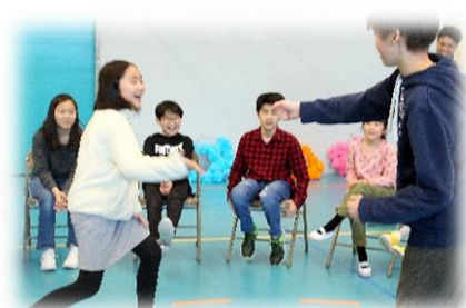
【レクリエーション】