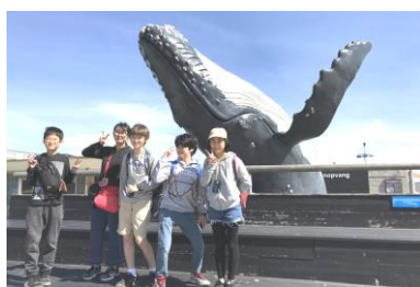
エコマーレ水族館にて