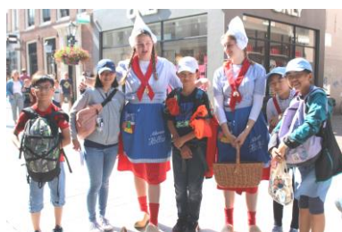
アルクマールにて

最終日は、チーズ市で有名な「アルクマール」の街で研修しました。子どもたちは、オランダで最も古い歴史をもつと言われていたチーズ市の見学から始まり、チーズ博物館、市立美術館、聖ラウレンス教会等を見学し、オランダのすばらしい文化や伝統に触れるとともに、人々の暮らしについて考えることができました。