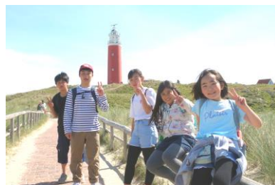
テクセル灯台にて

2日目は、「テクセル島」を自転車で巡りました。島の最北端に位置するテクセル灯台や美しい海岸、エコマーレ水族館、デンブルグの街探索など、地図と行程表を確認しながら活動を進めました。一日の走行距離がおよそ50kmという班もありましたが、みんなで協力し、互いに「がんばろう！」と励まし合いながら、最後までやり遂げるすばらしい子どもたちの姿が見られました。